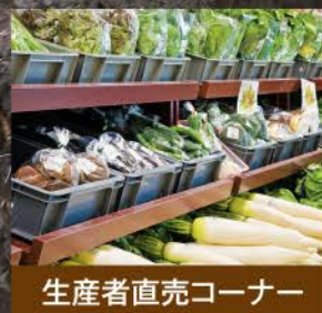
生産者直売コーナー